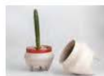
P34 PROYECTO: HATERIA EN CERAMICA, DISEÑO: ÁUREA SIA-N-KA'AN, AÑO: 2015, FOTOGRAFÍA: HARUHO KALES