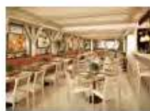
P47 PROYECTO: GUZINA OAXACA, DISEÑO: ESPACIO DE MUJERES ARTISTAS Y ASOCIADOS ARQUITECTOS Y BOUTÉ ARQUITECTOS, AÑO: 2015