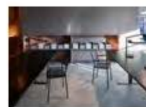
P45 BRENDA AUSTIN WWW.BRENDAJUSTIN.CO.UK