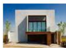
P40 PROYECTO: CASA LB, DISEÑO: SERKANO HONARAZ ARQUITECTOS, AÑO: 2004, FOTOGRAFÍA: SANDRA PEREZHIETTY JAIME NAVARRO