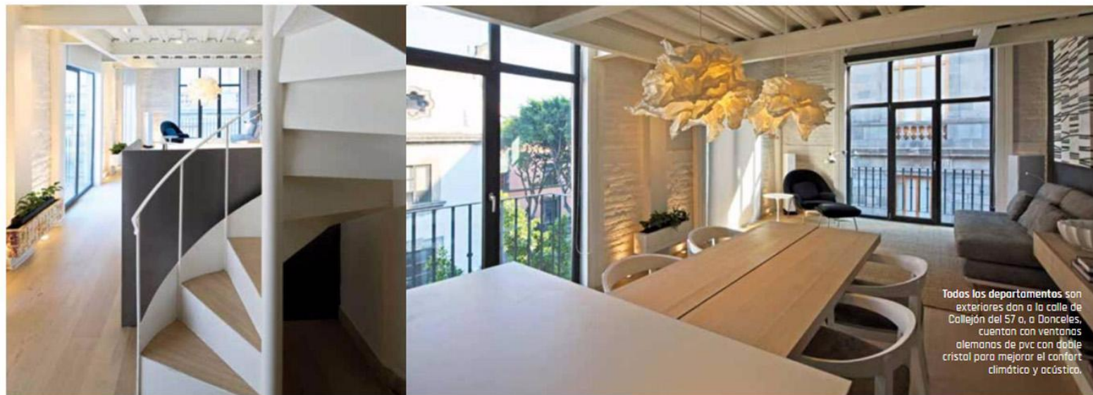
Todos los departamentos son exteriores dan a la calle de Callejón del 57 o, a Donceles, cuentan con ventanas alemanas de pvc con doble cristal para mejorar el confort climático y acústico.