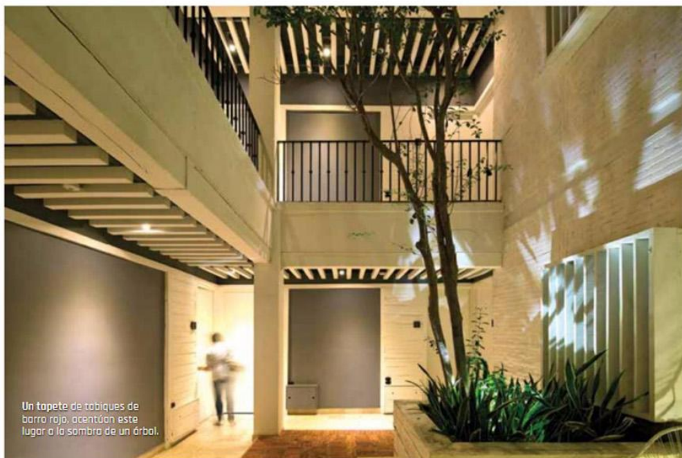
Un tapete de tabiques de barro rojo, acentúan este lugar a la sombra de un árbol.

ductores de los más de 1.330 m 2 de construcción intervenidos.