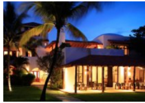
Hotel Esencia, el secreto mejor guardado de la Riv...