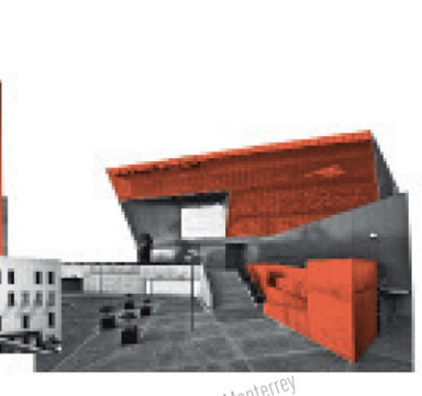
Corporativo Banorte Monterrey