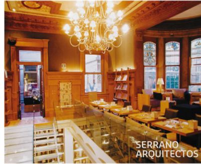
Librería Casa Lamm.