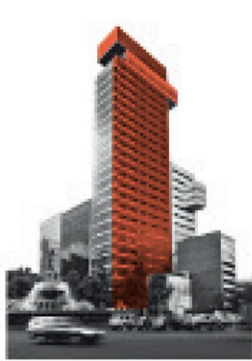
Edificio Reforma Diana

HABITACIONAL CASA DEPARTAMENTO LOFTS OFICINAS PREVENTA PROPIEDAD FRACCIONAL TERRENOS CASA DE PLAYA