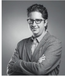
José Lew Arco Arquitectura Contemporánea