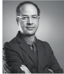
Juan Pablo Serrano Serrano Monjaraz Arquitectos, SMA