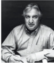
Gerardo Boué Boué Arquitectos