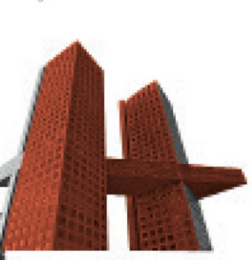
Torres Arcos Bosques