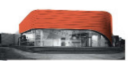
Centro de contacto DF