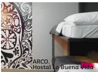
ARCO. Hostal La Buena Vida