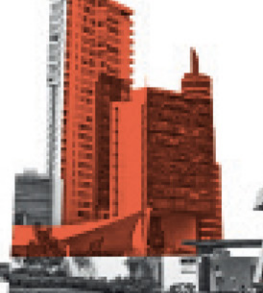
Central Park Querétaro