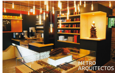
Chocolatería Que Bo!, DF.