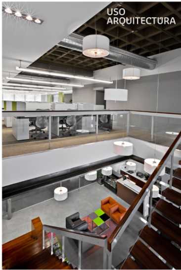
Corporativo Paga Todo, Santa Fe, DF.