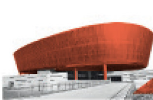
Call Center Querétaro