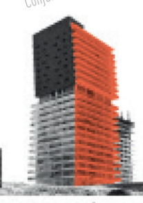
Central Park Querétaro