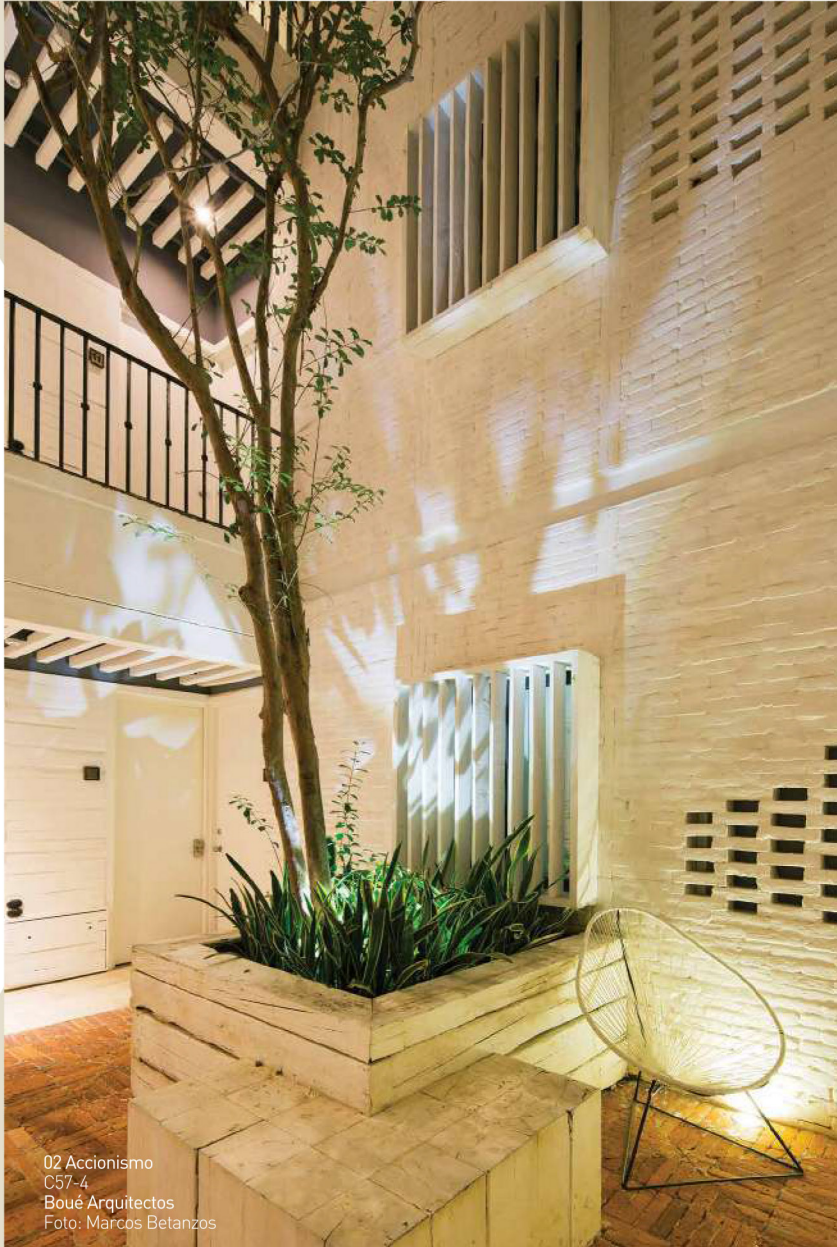
02 Accionismo C57-4 Boué Arquitectos