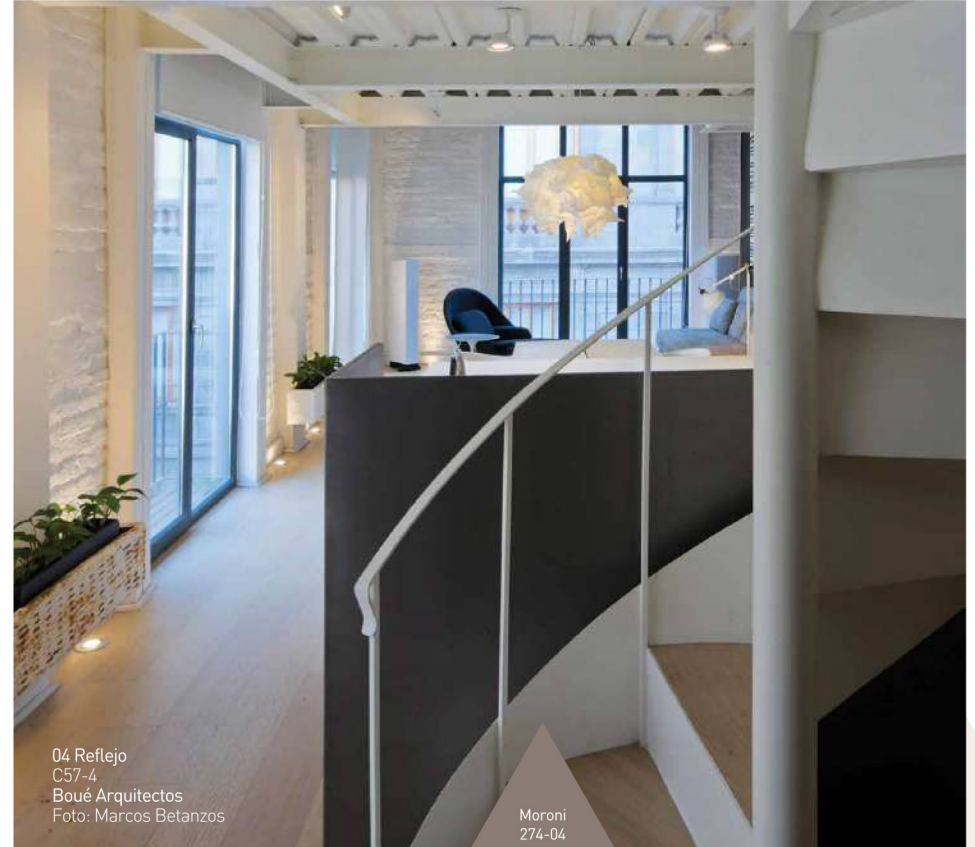
04 Reflejo C57-4 Boué Arquitectos