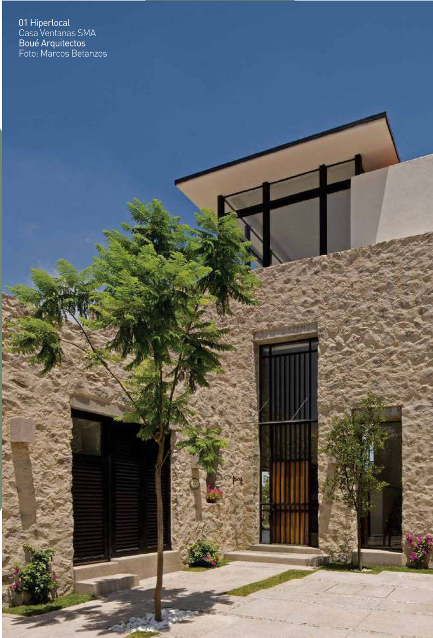
01 Hiperlocal Casa Ventanas SMA Boué Arquitectos