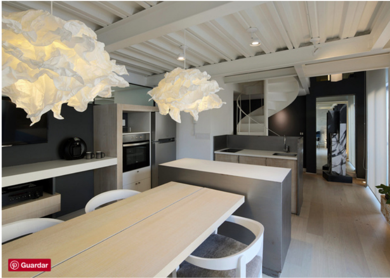
La paleta de colores en combinación de la iluminación hacen de este departamento un lugar cálido e íntimo.

Comodidad, privacidad y elegancia distinguen a este inmueble ubicado en un edificio de 1942.